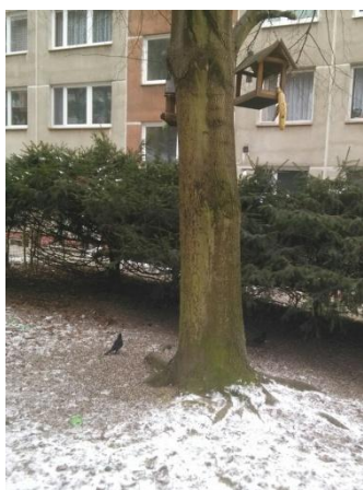
PTAČÍ BUDKA V ZIMĚ