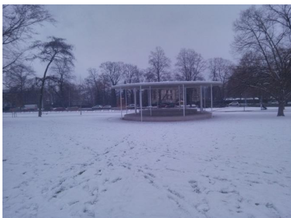
ALTÁNEK V PARKU

Každá vločka vypadá jinak, ale všechny jsou na stejném principu jako tahle. Na světě jich je několik tisíc, velkých, malých a kreslených a všechny vločky, které nám padají z nebe jsou stejné jako ty, které kreslíme