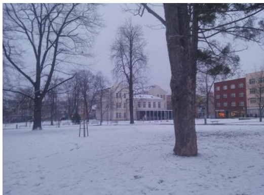
PARK V ZIMĚ