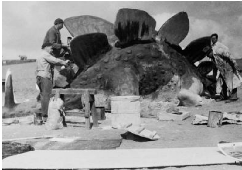
Cesta do pravěku (1955)

A právě spojení filmové a filmařské tradice dává zlínskému festivalu punc jedinečnosti. Na místě s tak jedinečnou historií totiž každoročně dochází k propojení dvou pólů filmového světa: diváckého a tvůrčího.