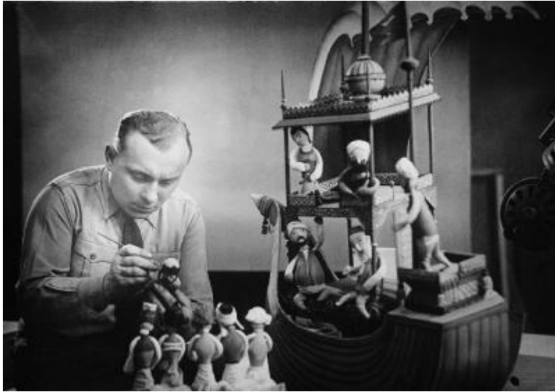
Poklad ptačího ostrova (1952)