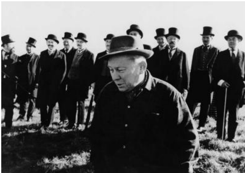
Ukradená vzducholod' (1966)